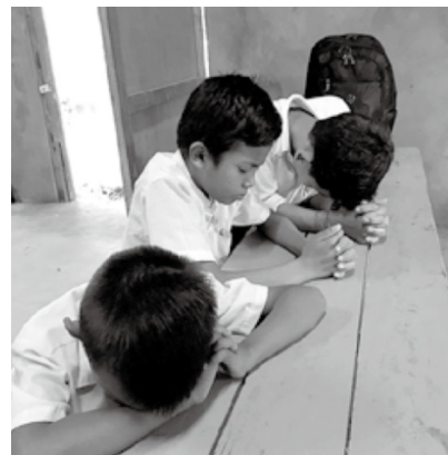
照片來自 2018 緬甸短宣

天父，祈求憐憫克什米爾的百姓，讓印度和巴基斯坦的領袖願意做出帶來和平的決定，不再有任何衝突和戰爭發生在這片佳美之地。懇求神讓福音能夠在克什米爾傳揚，神的話不被任何事物攔阻。求神使克什米爾人早日能從靈性與肉體的壓迫中得著釋放。但願印度的教會和信徒們能去關心克什米爾人，向他們活出基督的愛，使他們能從屬神的人身上看到和其他印度人不一樣的生命。但願基督和好的福音能發生在印度和克什米爾這兩個有裂痕的民族中。奉主耶穌基督的名求，阿們！